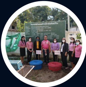
ถังขยะเปียก