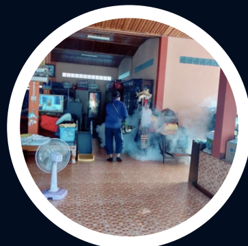
กิจกรรมครัวเรือนสะอาด ปราศจากโรคภัย