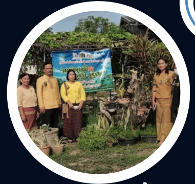
กิจกรรมทางนี้มีผล ผู้คนรักกัน