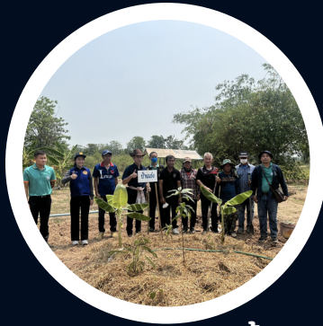
กิจกรรมบ้านนี้มีรัก ปลูกผักกินเอง