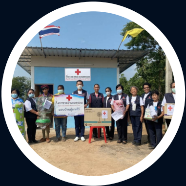
กิจกรรมซ่อมแซมบ้าน/ สร้างบ้าน ให้ผู้ยากไร้