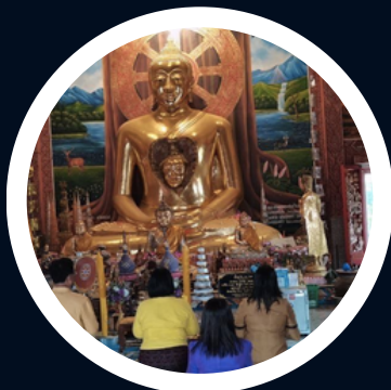
กิจกรรมธรรมะ สร้างสุข