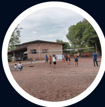
กิจกรรมขยับกาย สบายชีวิ