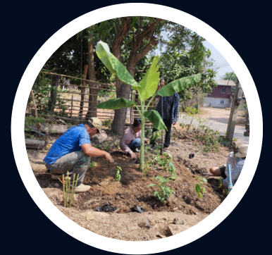
กิจกรรมปลูกสมุนไพร ปลูกด้วยใจ ต้านโรค สร้างสุข